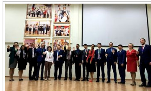
15 лауреатов всероссийского финала конкурса Учитель года России-2016

Пятнадцать лауреатов Всероссийского конкурса "Учитель года России"-2016 объявлены сегодня на торжественной церемонии подведения итогов заочного и первого очного туров. В 15-шку вошли участники конкурса, набравшие максимальное количество баллов по итогам двух испытаний заочного тура "Эссе" и "Интернет-ресурс", а также двух испытаний первого очного тура – "Урок" и "Методический семинар".